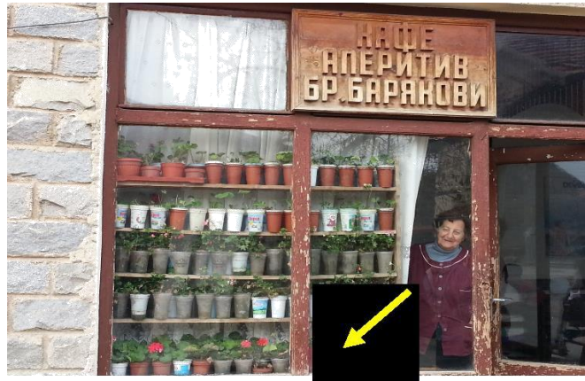
град Банско, 2013 г., със стрелка е посочено мястото на табелката за звездната категоризация на заведенията - един от отживелите режими

Причината е огромната съпротива срещу премахването на основни административни и регулаторни тежести. Развитието продължава да се блокира от бюрократи или определени групови интереси. Те пазят ревностно статуквото, тъй като облекчаването на режими води до загуба на власт и влияние.