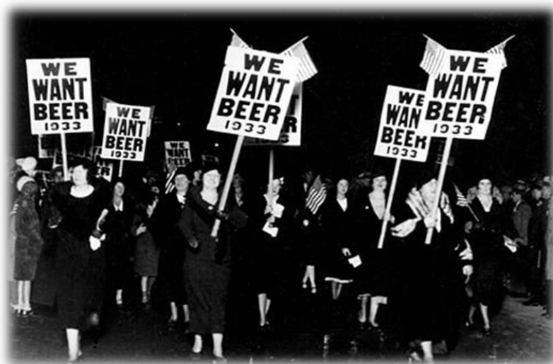
Снимка интернет: протест срещу забраната за консумация на алкохол, отбелязана е годината, в която се разрешава консумацията на алкохол в САЩ.

В света са налични редица примери за лошо регулиране и регулаторни провали, които внимателно следва да изследваме, за да се намали вероятността те да се възраздат и мултиплицират. Безспорно един от най-големите регулаторни провали е забраната за консумацията на алкохол в САЩ (1920-1933). Генералната идея за въвеждането на сухия режим е намаляване на престъпността, на нарушенията на обществения ред и корупцията, както и подобряване на здравния статус на нацията. Резултатът от инициативата е провал във всички области – престъпността става добре организирана, корупцията придобива застрашителни размери, закрива се бизнес, настъпва пик на сивата икономика, от което намаляват постъпленията в бюджета от данъци и такси, закриват се и работни места. Поради тези причини, а и поради липсата на здравен контрол върху качеството на алкохола, се нанасят редица щети върху човешкото здраве, респективно върху здравната система. Някои данни показват, че консумацията на алкохол намалява единствено в годината след реалното въвеждане на режима (1921) поради шока и все още неориентирания черен пазар, а впоследствие нараства многократно и никога не достига до нивата на годината преди забраната 1919 г. 5